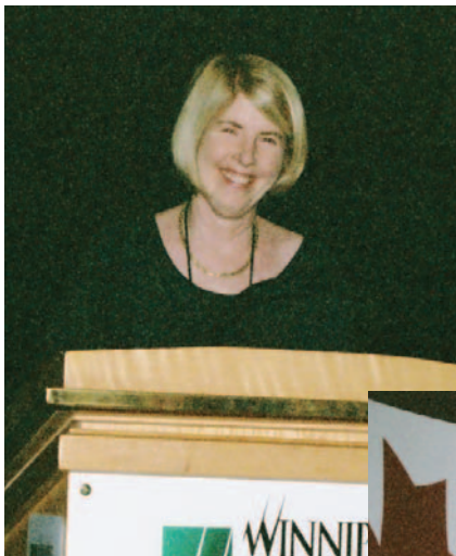
Dr. Kay Redfield Jamison, The Johns Hopkins Hospital

Si vous n'étiez pas présent à la cérémonie de remise des prix au congrès, vous pouvez lire les allocutions des prix dans le numéro du printemps de Psychologie canadienne. Nous devrions nous sentir fiers de compter sur ces excellents psychologues dans nos rangs. Nous tenons à remercier tous nos collègues qui ont préparé les nominations et les lettres d'appui.